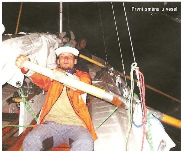
První směna u vesel